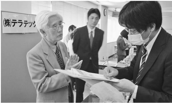
▶金融機関・マスクミ等へ説明を行う (有)ザ型屋ドットコム(上)・(株)テラテック(下)